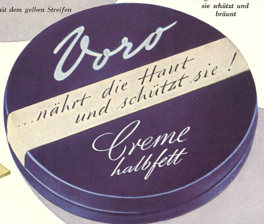
Die blaue Dose mit dem weißen Streifen

Bei Haushaltarbeit zur Pflege der Haut altbewährt und altbekannt