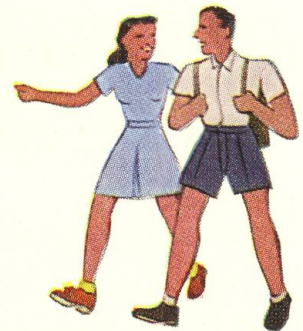
Bei Spiel und Sport die gute Voro-Creme: sie schützt und bräunt