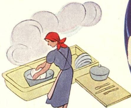
Bei Haushaltarbeit. zur Pflege der Haut altbewährt und altbekannt