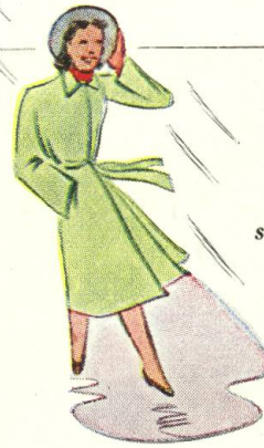
Voro-Creme schützt die Haut bei Wind und Wetter