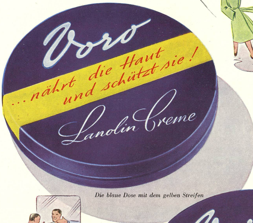
Die blaue Dose mit dem gelben Streifen

Voro-Creme zu jeder Zeit — für Gesicht und Hände