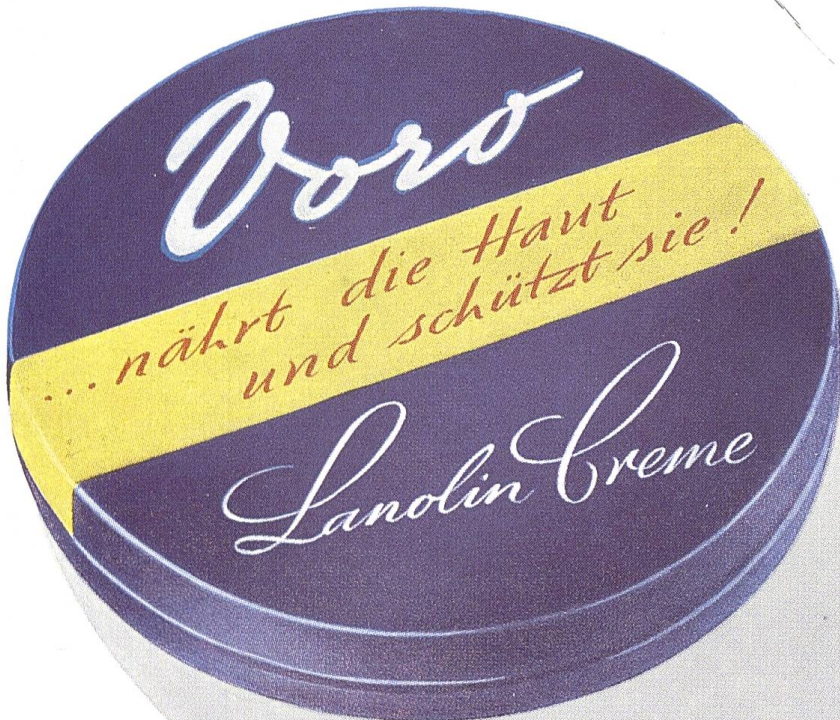
Die blaue Dose mit dem gelben Streifen