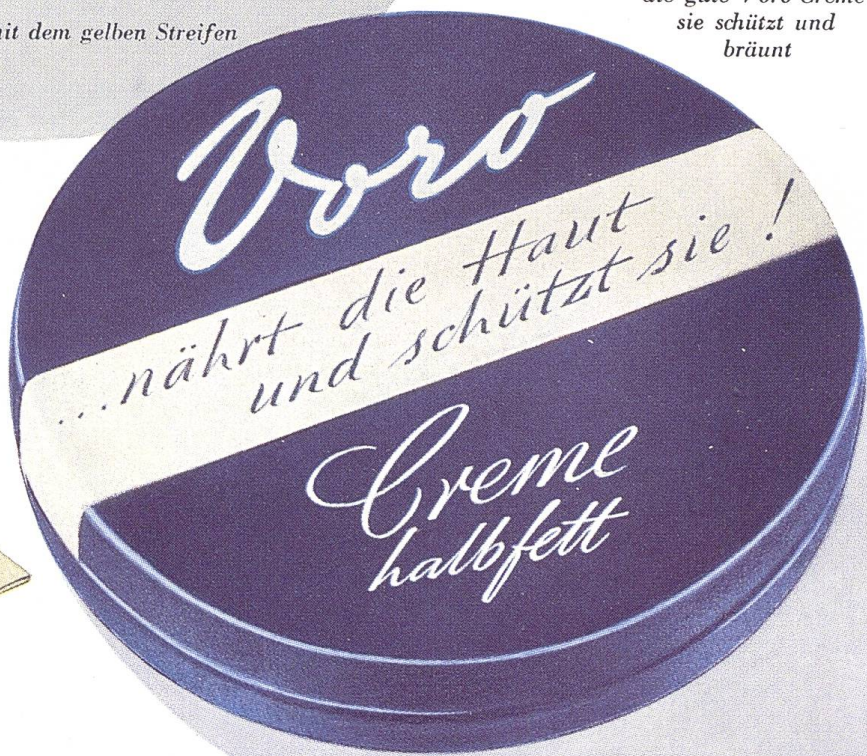
Die blaue Dose mit dem weißen Streifen

Bei Haushaltarbeit. zur Pflege der Haut altbewährt und altbekannt