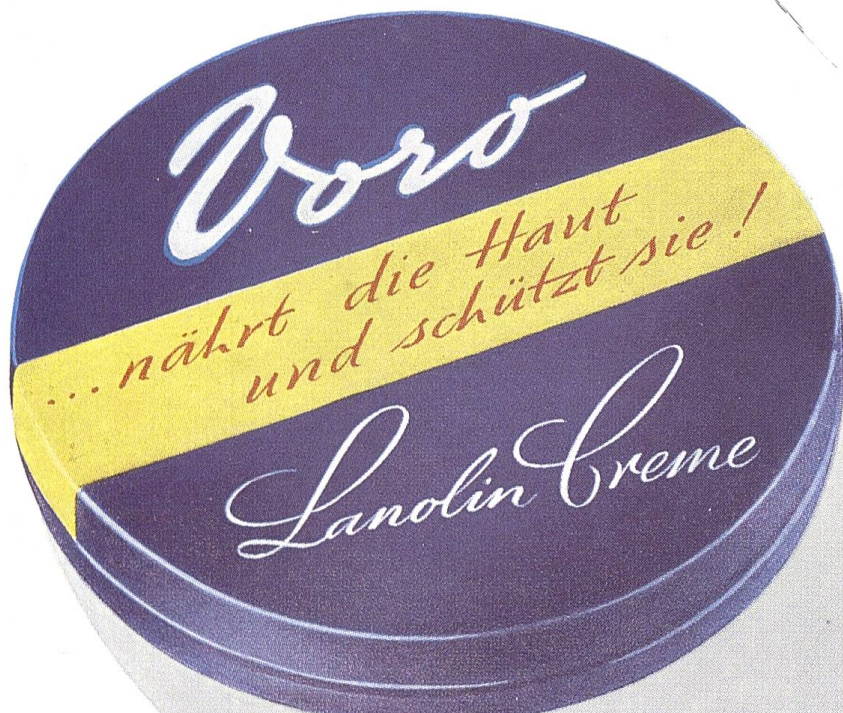
Die blaue Dose mit dem gelben Streifen

Voro-Creme zu jeder Zeit—für Gesicht und Hände