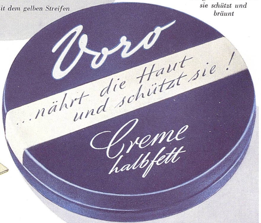
Die blaue Dose mit dem weißen Streifen

Bei Haushaltarbeit zur Pflege der Haut altbewährt und altbekannt