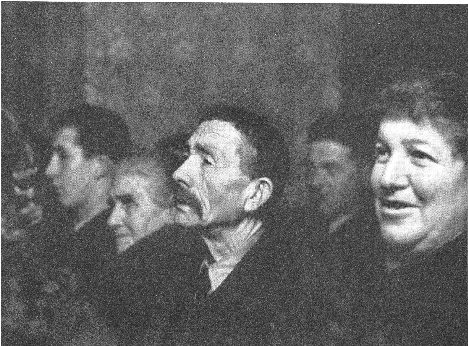
Die Zuschauer (Gespielt wurde «Der Wilderer»)