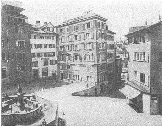
Stüssihofstatt Zürich: Alter Zustand

Die Abbildungen stammen aus dem Buch «Die Sanierung der Altsiedle» von Nationalrat Ernst Reinhard. (Polygraphischer Verlag AG., Zürich)