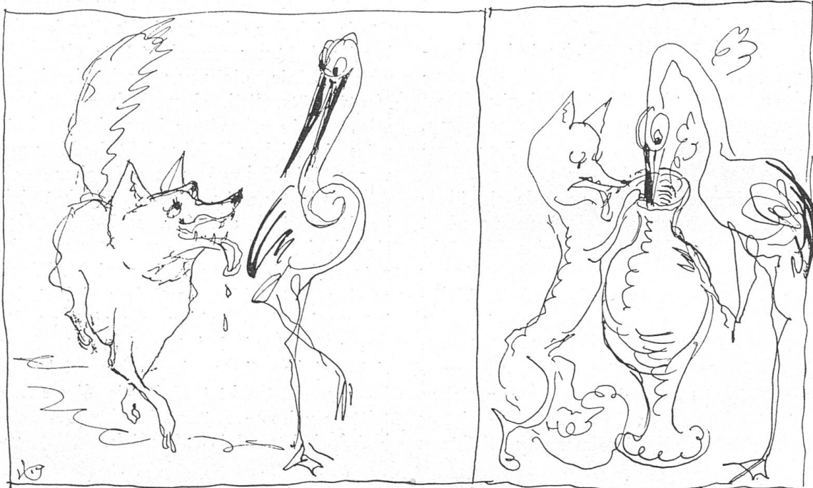
... oder der betrogene Betrüger!