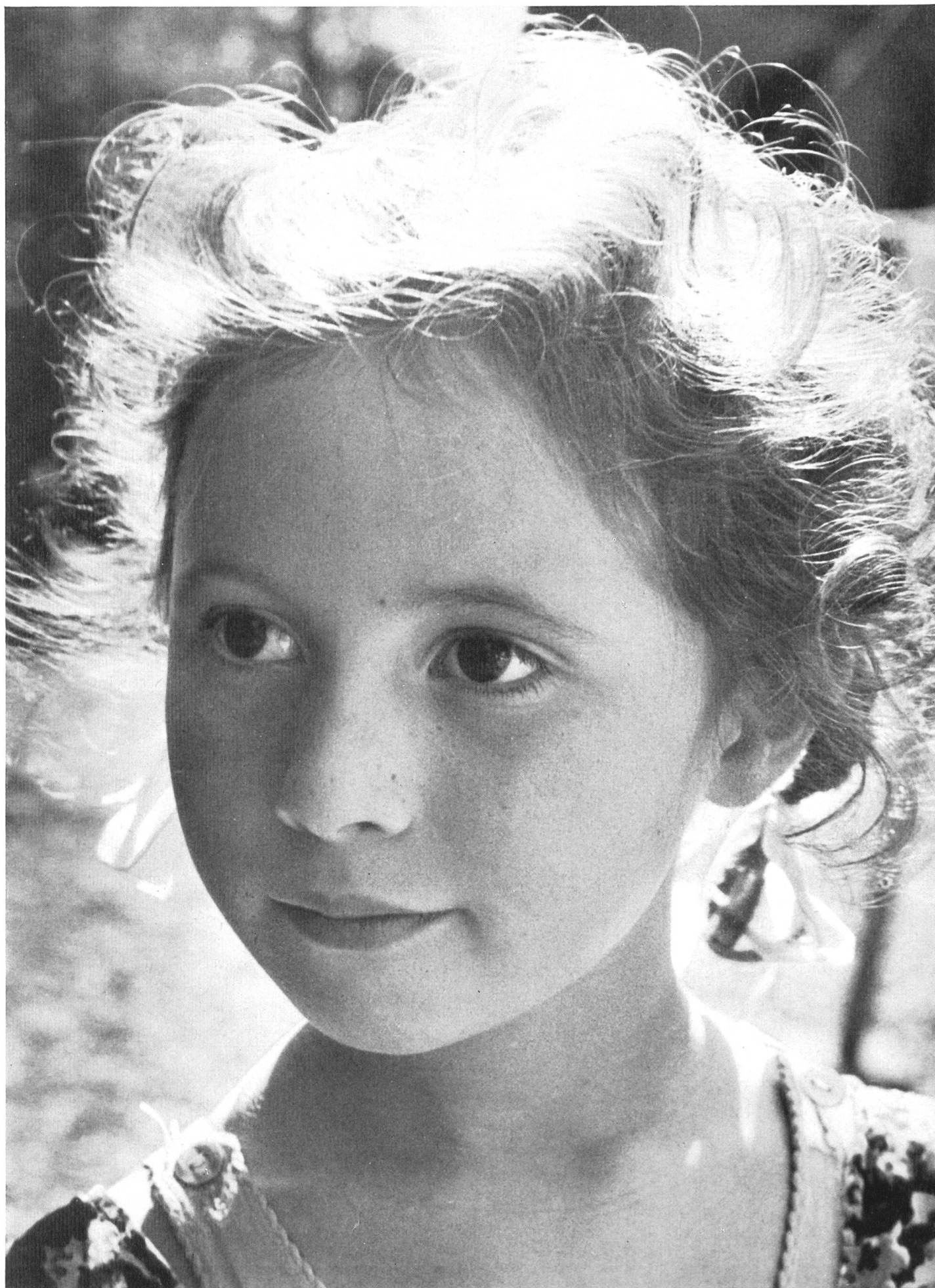
M. A. Wyß, Luzern

Wir haben einige führende Schweizer Photographen gebeten, uns das Bild zuzusenden, das sie als ihr bestes betrachten und bringen in diesem Heft die Wiedergabe dieser Aufnahmen zum Abschluß.