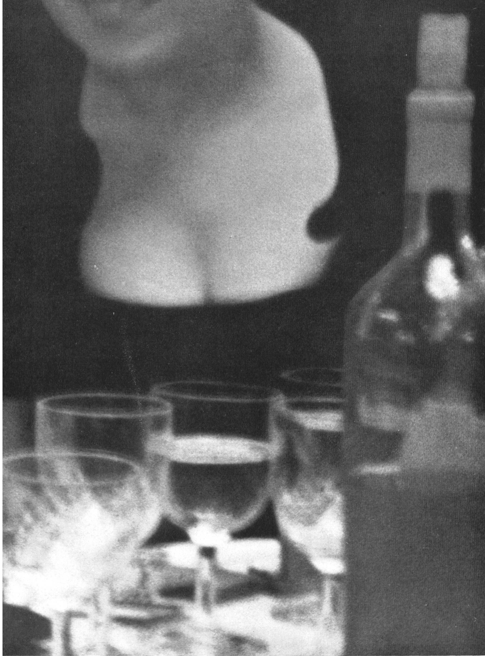
Jakob Tuggener, Zürich Bar