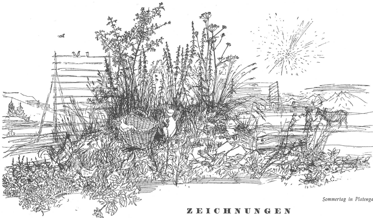
Sommertag in Platenga