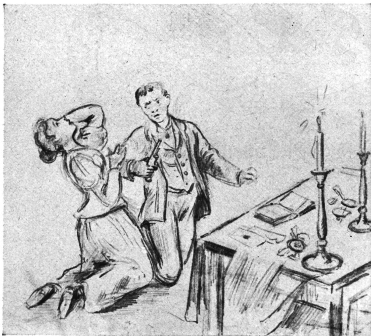
„Sterben, oh sterben, und noch so jung und schön!“