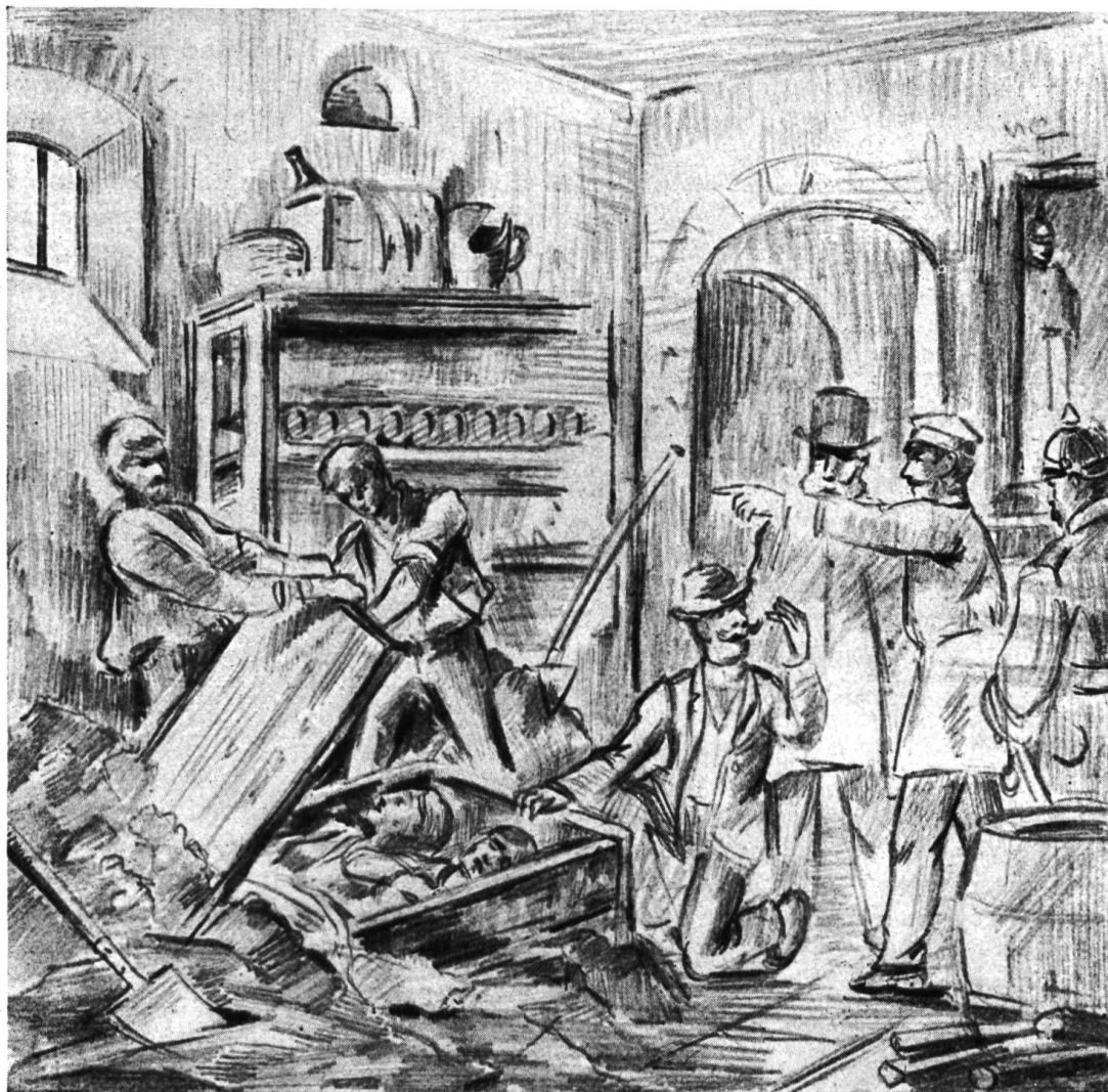
„Ein Bild des Grauens enthüllte sich den entsetzten Blicken“

Die Bildreportage in den Tageszeitungen ist keine Erfindung der Gegenwart, nur trat an Stelle des Zeichenstiftes die Kamera. Der Schweizer Maler C. Moos war um die Jahrhundertwende als Neunzehnjähriger als «Spezialzeichner» der Neuen freien Volkszeitung in München beschäftigt. Die hier wiedergegebenen Zeichnungen geben ein anschauliches Bild dieser Tätigkeit.