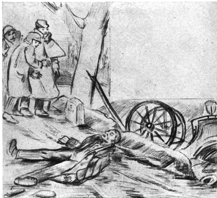
„Da lag er, der einst so wackere Rutscher — eine kalte Leiche.“