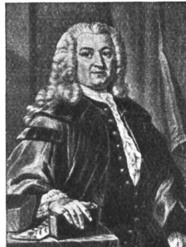
Zeremonial-Portrait. Der Berner Ratsherr Alb. von Haller mit allen Abzeichen seines Standes um 1730.