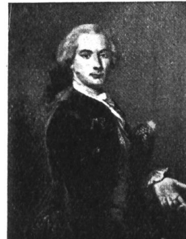
Portrait des Rokokos - ein Mann von Welt in spontan-persönlicher Haltung, von E. Handmann, 1751.