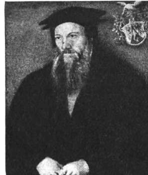
Der humanistische Gelehrte der Renaissance: Conrad Geßner, von Tobias Stimmer, 1564.