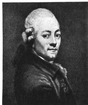
Die zeremoniöse Ausstattung weicht dem Interesse am Individuellen. Selbstportrait v. A. Graff, 1794.