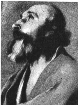
Charakterkopf in ekstatischer Haltung. Barock-Portrait italienisch-kirchlichen Stils von G. Peltrini.