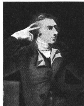
Portrait der Romantik: Übersteigert gefühlvolle, spontane Haltung. Selbstbildnis v. H. Füßli, 1781.