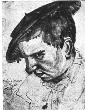
Renaissancemäßig private Haltung, spontanes Selbstportrait des Malers Tobias Stimmer, um 1565.