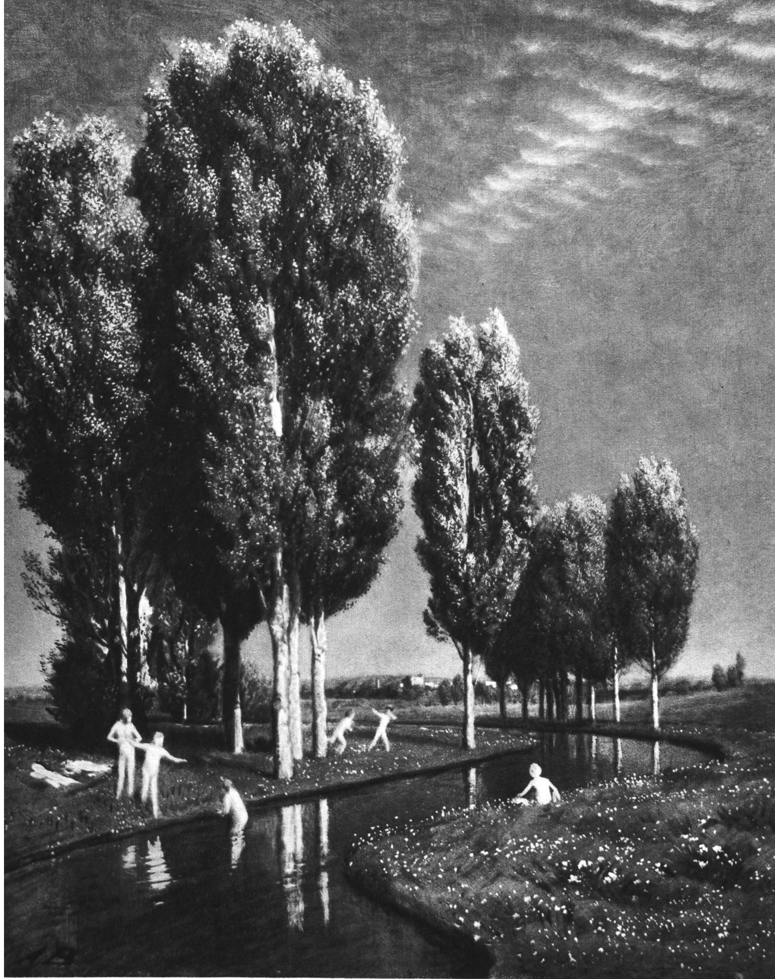
Arnold Böcklin, Sommertag (Gemälde-Galerie Dresden)