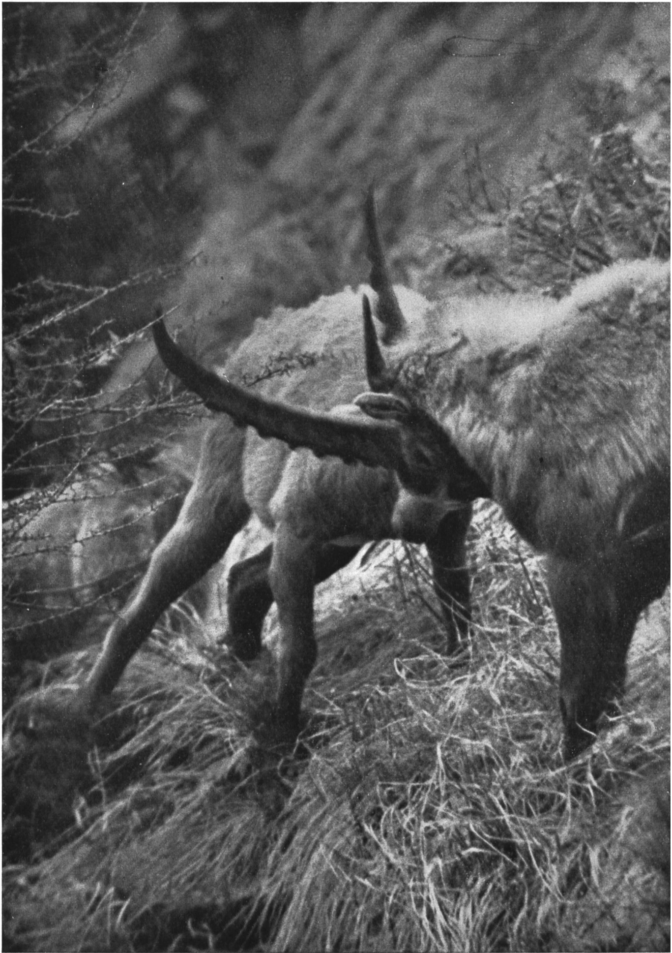
Eine seltene Aufnahme: Kämpfende Steinböcke.