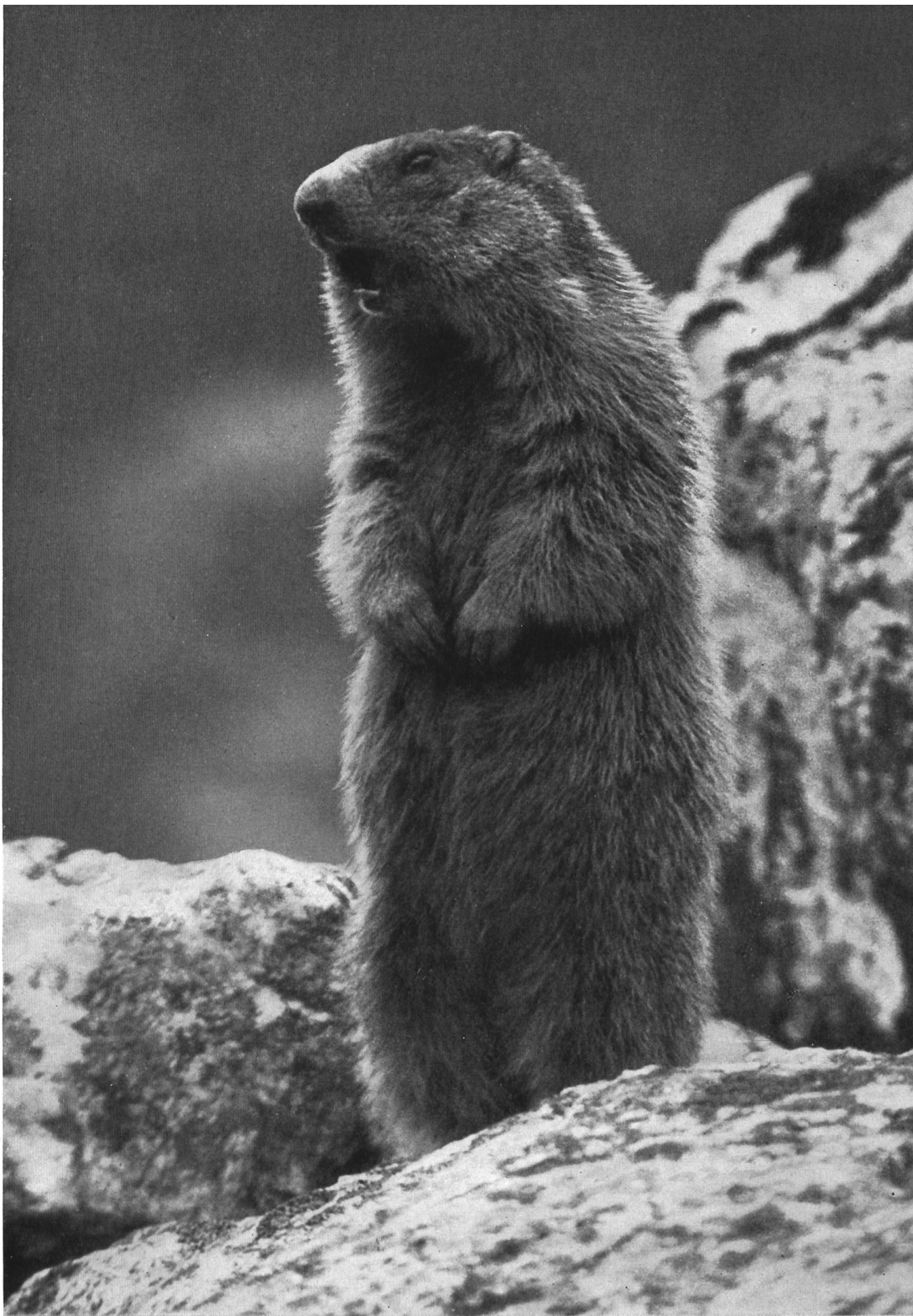
Das Murmeltier pfeift: Gefahr in Sicht.