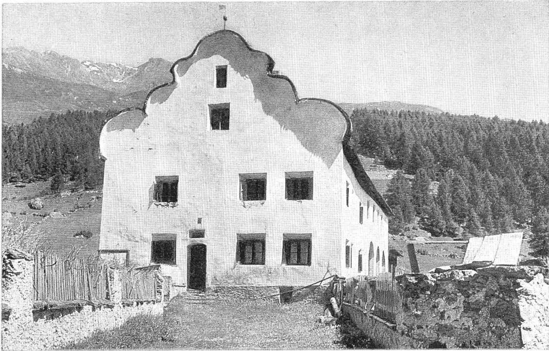
Bos-cha bei Guarda. Giebelhaus

Ein unentbehrlicher Begleiter für alle Heimat-Fahrten ist der