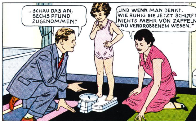
DENN OVOMALTINE STÄRKT KÖRPER UND NERVEN UND FÖRDERT DAS WACHSTUM.

Nur Ovomaltine-Erfolge schafft Ovomaltine