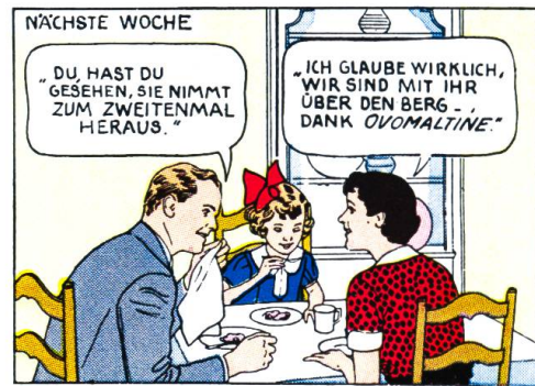
DA HILFT NUR EINES: OVOMALTINE.