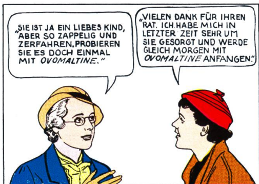
DIE LEHRERIN IST AUCH NICHT RECHT ZUFRIEDEN.