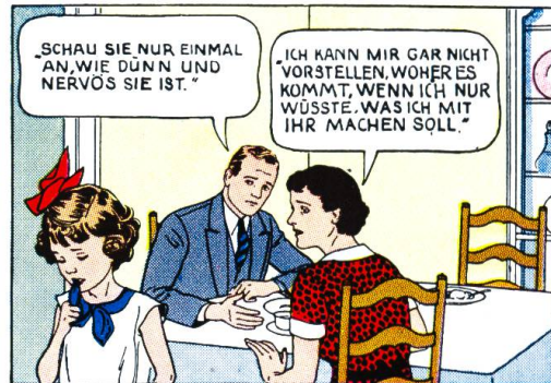
SIE MAG NICHT SPIELEN.