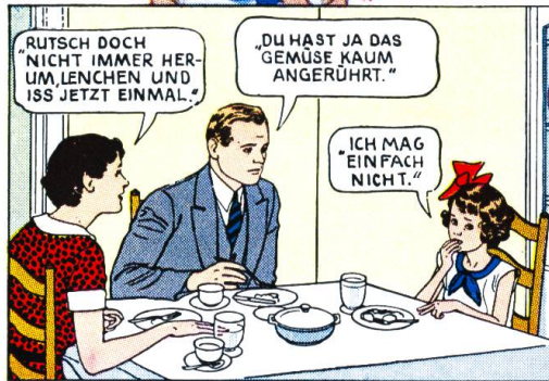
SIE MAG NICHT ESSEN.