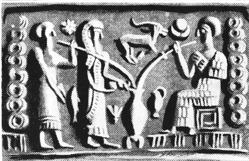
Biertrinken aus Röhren (Altbabylonischer Siegelzylinder).