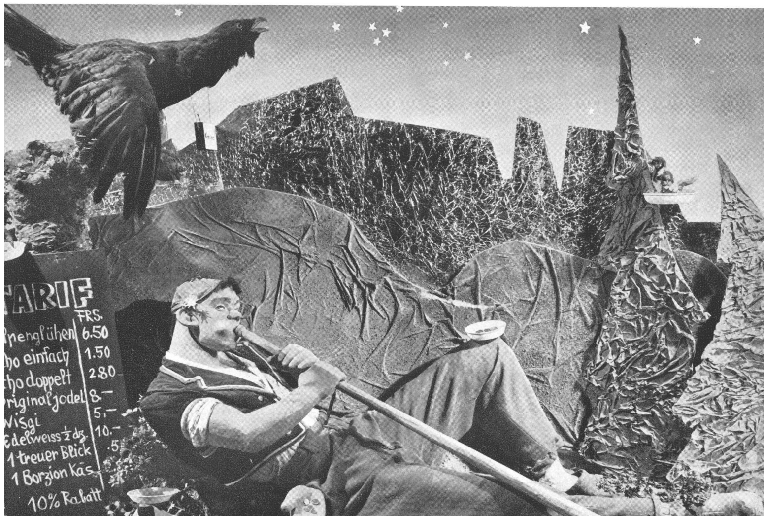
Unten: „Ich bin ein Schweizerknaibe“