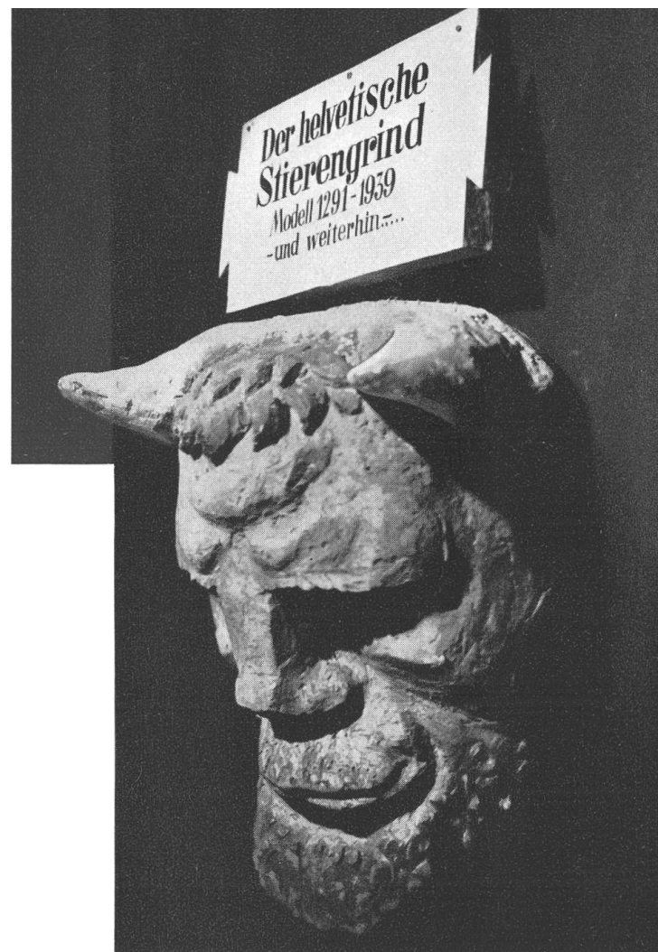
Oben: Der helvetische Stierengrind