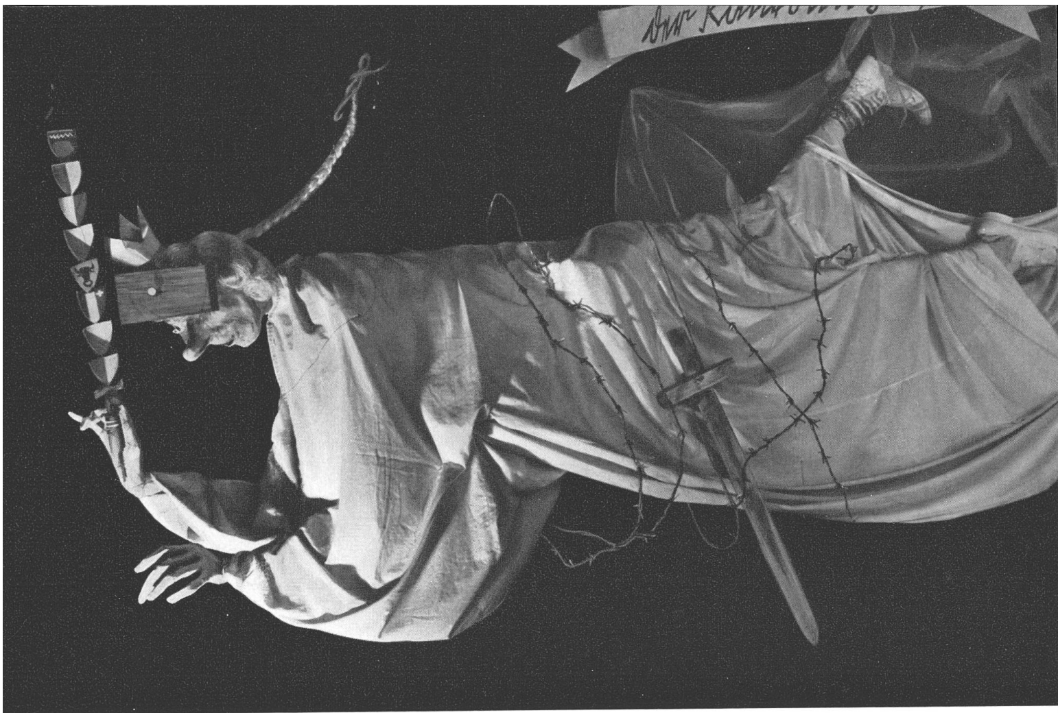
Oben: Der Kantonlidgeist