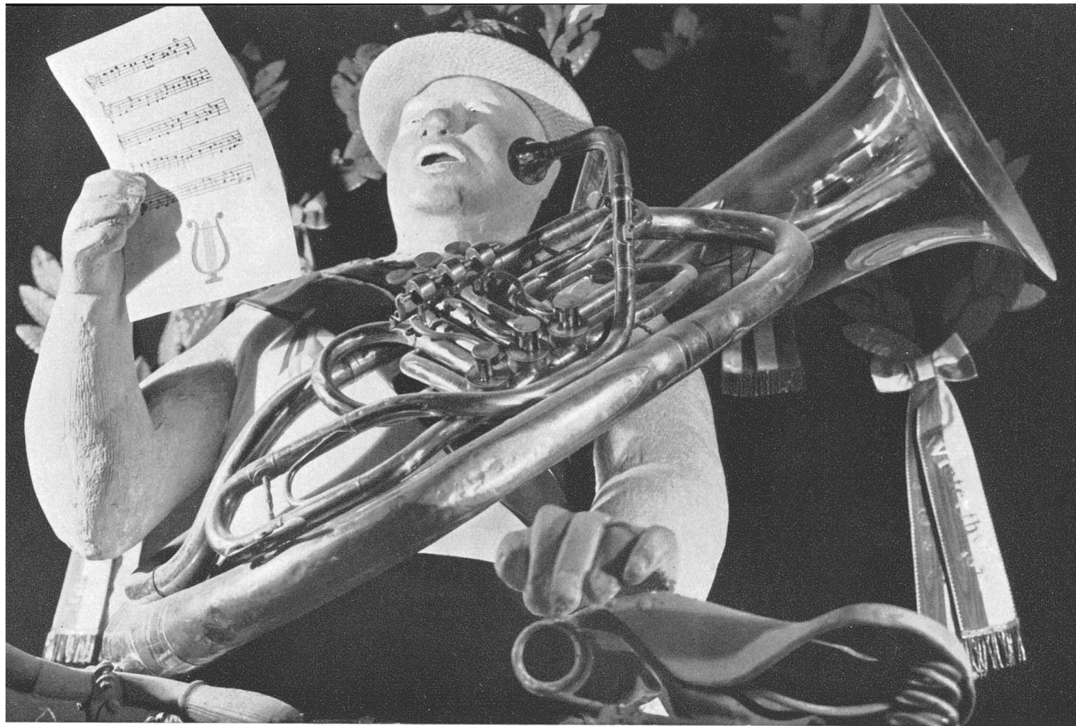
Oben: Der Fest- oder Überschweizer