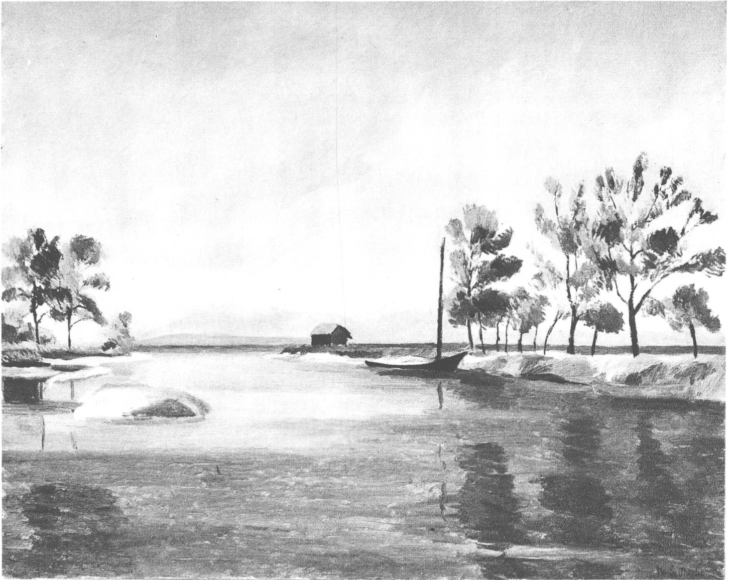
Eugène Martin, L'estuaire (©I)