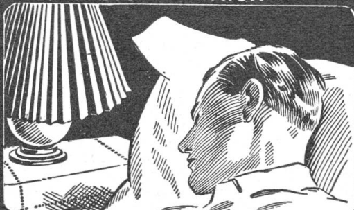
fast über Nacht.