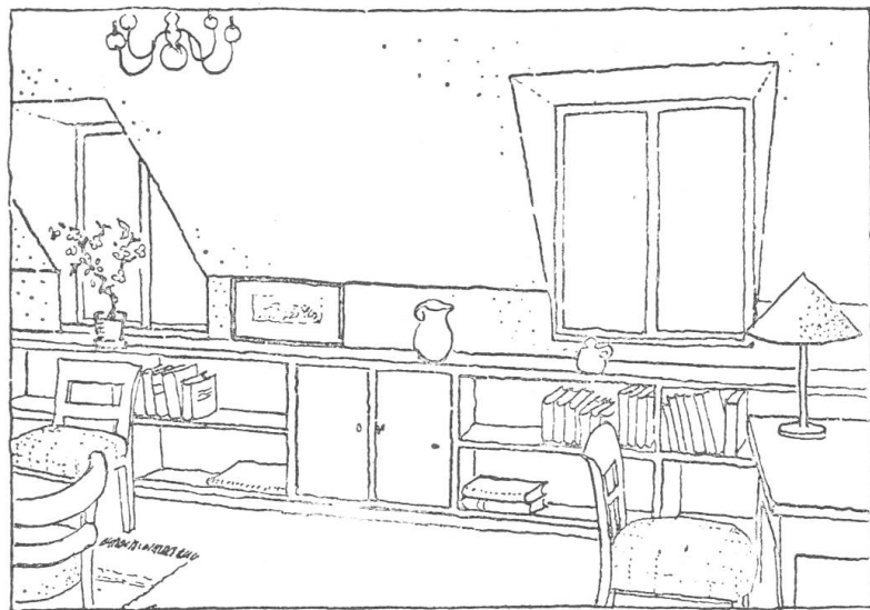
Vorderansicht der Mansarde

eignen. Der auf den Bildern gezeigte Raum ist sehr schmal, alles ist darauf angelegt, dass die Möbel so wenig wie möglich füllen sollen. Man entbehrt bei dieser Art der Möblierung vielleicht etwas Wärme, ein oder zwei tiefe Sessel würden wohltuend wirken, aber man kann dennoch nicht bestreiten, dass das Interieur selbst mit diesen einfachen und etwas strengen Möbeln sehr hübsch ist.