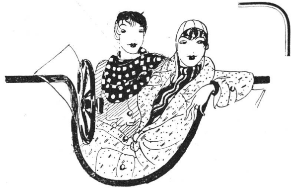
DIE KLEINEN KAPPEN UND MUTZCHEN

DIE LEUCHTENDEN FAR- BEN UND GANZ BESTIMMT DEN KURZEN ROCK WIE DIE KURZEN HAARE, DAS ALLES VERDANKT DIE FRAU DEM SPORT