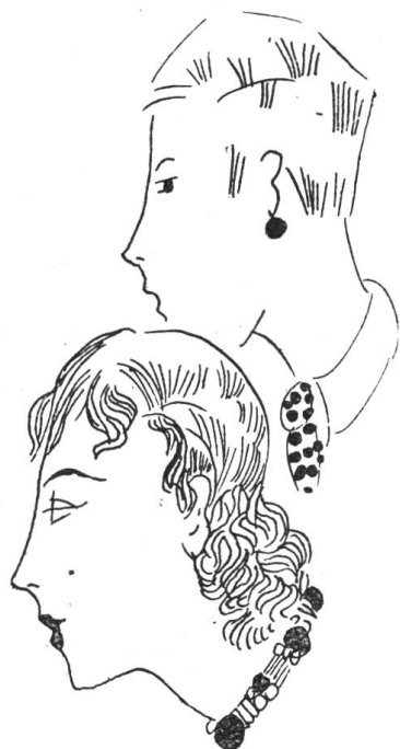
Veränderung der Frisur: