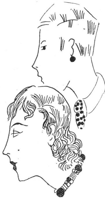
Veränderung der Frisur: