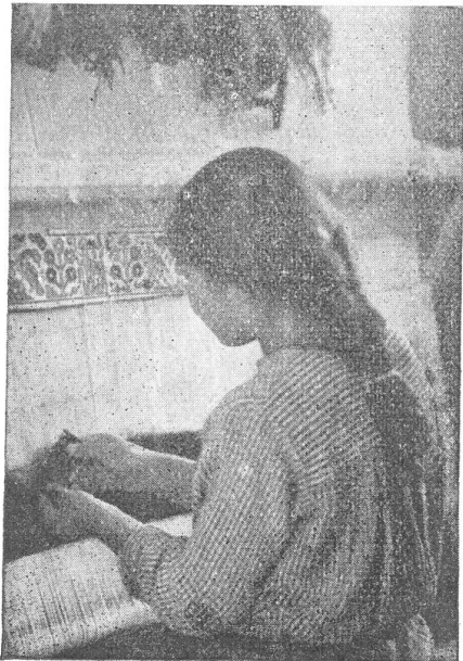
Mehrere Noppenreihen sind fertig, sie müssen gekämmt werden, denn so öffnen sich die Wollenden und lassen ein schönes Flies des Teppichs erzielen.

Nur wenn jede Manipulation äusserst sorgfältig durchgeführt wird, kann die Qualität erreicht werden, welche die Ghazir-Teppiche auszeichnet. In Ghazir werden Teppiche bis zu 30 Knoten auf den cm 2 erstellt.