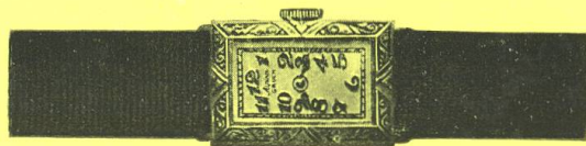
Gruen-Cartouche, massiv Gold Fr. 195.— und Gruen „PRECISION“-Werk auf 17 Steinen Fr. 285.—

An diesem Wappen erkennen Sie die Verkaufsstellen für Gruen-Uhren. Nur feine Geschäfte, Geschäfte von Rang und Ruf, führen dieses Zeichen