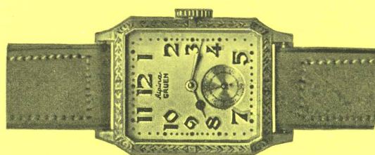
Gruen-Typ Fr. 165.—

Eine Gruen wird Ihren Sohn täglich an das Elternhaus erinnern