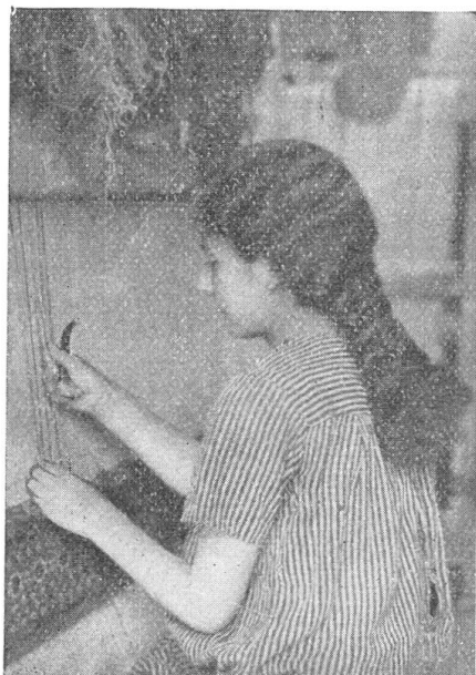
Mit der rechten Hand werden zwei Zettelfäden auseinandergehalten, mit der linken das Wollgarn durchgezogen und der Noppen (Knoten) gemacht. Hierauf wird das Wollende mit dem Messer abgeschnitten.

Durch ihre von Hand geknüpften orientalischen Teppiche senden die armenischen Waisenkinder Grüsse ins Schweizerland, danken sie ihren Freunden und Gönnern. Ihre Qualitätsarbeit wird ermöglicht durch Verwendung nur erstklassiger Rohmaterialien, vegetabile Farben usw. Die Produkte gelangen direkt vom Knüpfstuhl weg in die Hände der Bezüger, also zu sehr vorteilhaften Preisen.