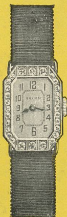
GRUEN Cartouche mit Brillanten zu Fr. 575. Andere GRUEN Brillantuhren von Fr. 435 bis Fr. 10,000

Vor 80 Jahren haben sich die ersten Uhrmacher in dem malerischen Städtchen niedergelassen. Durch ihre Tüchtigkeit und Arbeitsamkeit legten sie den Grundstein zur späteren Entwicklung der Uhren-Industrie. Das Handwerk vererbte sich von einer Generation auf die andere und so wurde die Uhrmacherei zur Überlieferung.