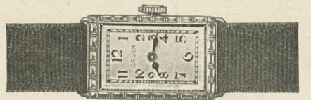
Gruen Cartouche Weiss- oder Grüngold „PRECISION“ 17 Rubis Fr. 285.—