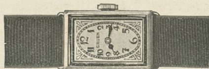
Gruen Cartouche Weiss- oder Grüngold „PRECISION“ 17 Rubis, mit den neuen Gruen-Emaildekorationen Fr. 310.—

Gruen Cartouchen mit Brillanten „PRECISION“- Werk, 17 Rubis, von Fr. 500.— an