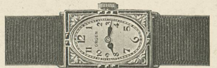
Gruen Cartouche Weiss- oder Grüngold „PRECISION“ 17 Rubis, mit den neuen Gruen-Emaildekorationen Fr. 310.—