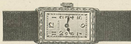
Gruen Cartouche Weiss- oder Grüngold „PRECISION“ 17 Rubis Fr. 285.—