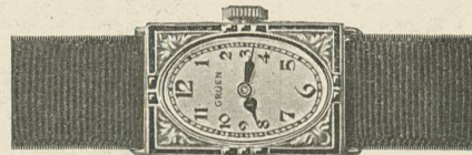
Gruen Cartouche Weiss- oder Grüngold „PRECISION“ 17 Rubis, mit den neuen Gruen-Emaildekorationen Fr. 310.—