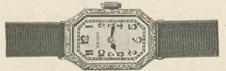
Gruen Cartouche Weiss- oder Grüngold „PRECISION“ 17 Rubis Fr. 285.—