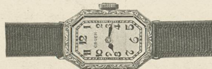
Gruen Cartouche Weiss- oder Grüngold „PRECISION“ 17 Rubis Fr. 285.—