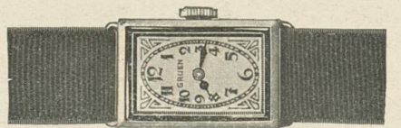
Gruen Cartouche Weiss- oder Grüngold „PRECISION“ 17 Rubis, mit den neuen Gruen-Emaildekorationen Fr. 310.—

Gruen Cartouchen mit Brillanten „PRECISION“- Werk, 17 Rubis, von Fr. 500.— an