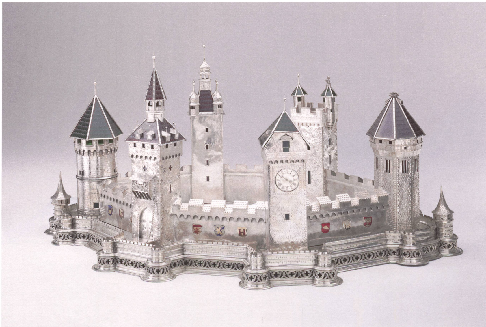
Abb.3 Burg als Tafelaufsatz, Bossard & Sohn, Luzern, um 1910, Silber getrieben, gegossen, gewalzt, graviert, ziseliert und farbiges Glas, L. 100 cm, B. 68,8 cm, ca. 16 250 g. SNM, LM 184817.