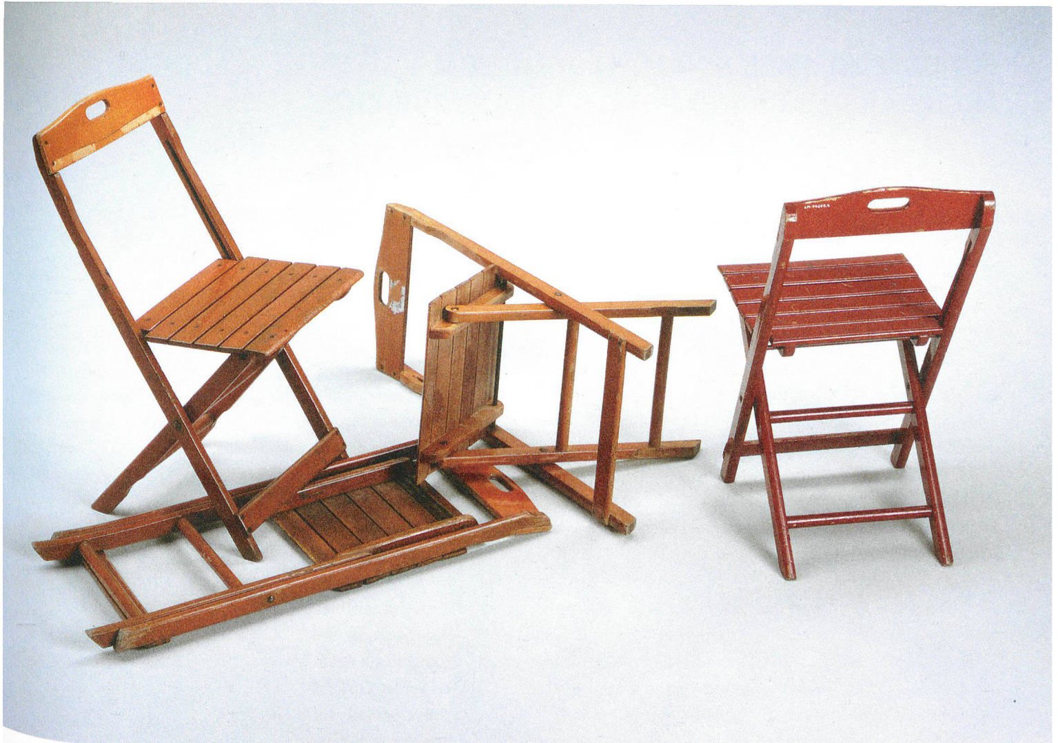
19| Vier Klappstühle, um 1960, 97 x 38 cm, welche die Stuhlschlacht nach dem Konzert der Rolling Stones am 14. April 1967 heil überstanden haben. LM 94607.1-4.