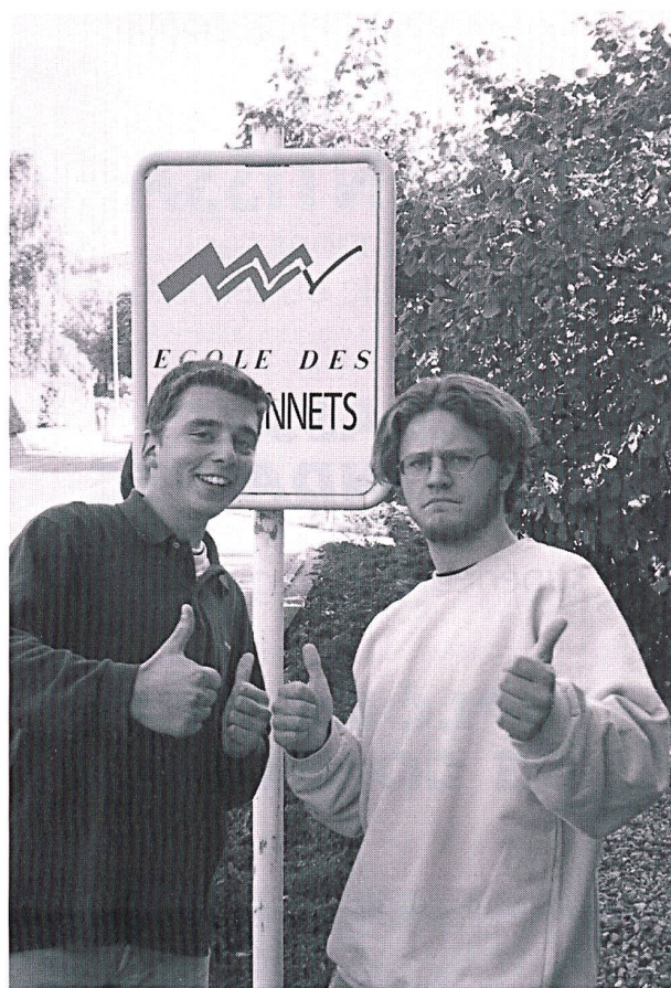
Les élèves des Buissonnets s'identifient fortement à leur école.

Si donc l'on peut s'étonner qu'une communauté religieuse ait pu susciter un état d'esprit si novateur, on doit se souvenir que – précisément – une communauté de sœurs est, peut-être, plus que d'autres