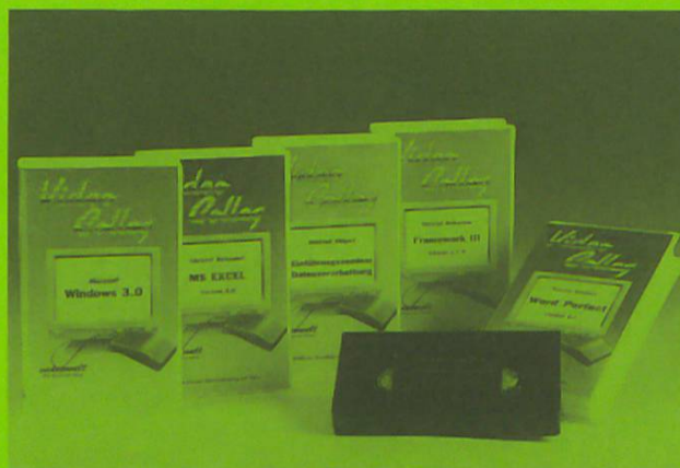
Video Colleg – die Softwareschulung auf Video

Sie darf in keinem modernen Betrieb fehlen! Denn mit Video Colleg können Sie erhebliche Kosten einsparen