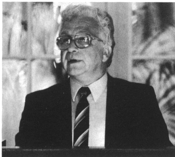
Le créateur de la Fondation Franz Michel...

Nous sommes à la veille d'une nouvelle étape importante pour l'avenir de l'école privée. Tous ceux qui participent à cette entreprise sont aujourd'hui nos invités, que ce soit à titre d'initiateurs, de promoteurs, d'exécutants ou de propagateurs auprès du public des idées qui nous tiennent à cœur.