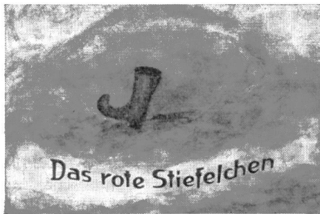
Das rote Stiefelchen