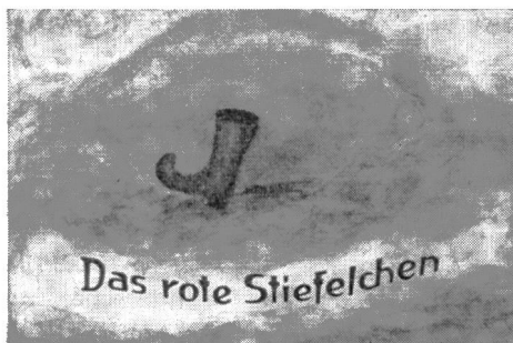
Lucia Grosse: Das rote Stiefelchen

Bilderbuch, 24 Seiten 31 x 22,5 cm, Fr./DM 27.50