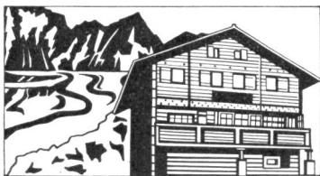
Naturfreundehaus Chalet Lüg ins Land 3981 Riederalp VS 1950 m ü. M.

Für Skilager geeignet. Gut eingerichtet. Platz für 42 Personen. Zu vermieten vom 8. bis 20. Januar 1973 und 18. bis 30. März 1973.