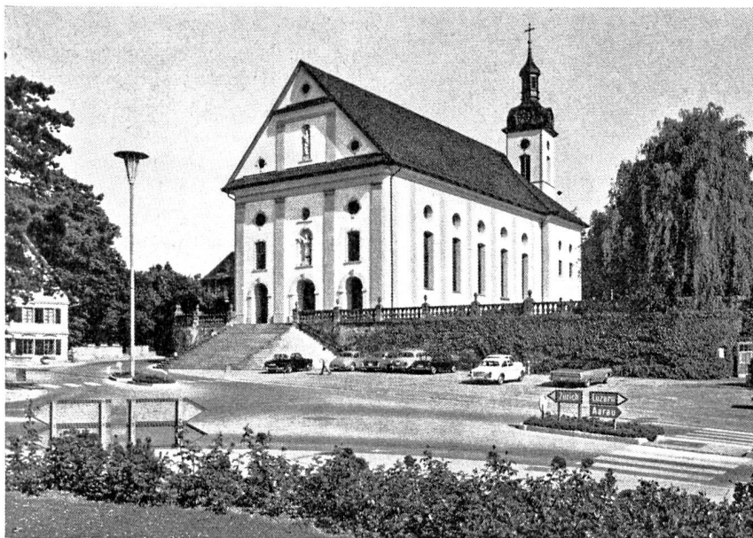
Das Wahrzeichen von Wohlen ist die Pfarrkirche St. Leonhard