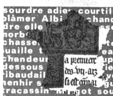
TABLEAU DE LA LANGUE FRANÇAISE