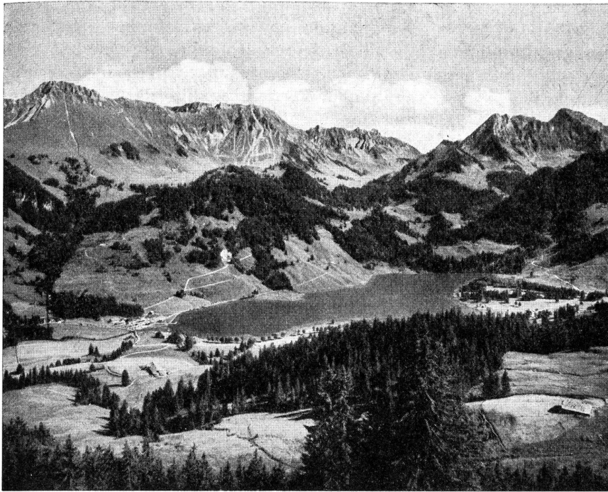
Vue général du lac Noir

A l'arrière-plan, les chaînes de la Kaiseregg (2188 m.) et de la Spitzfluh (1957 m.). Entre deux, le vallon des Neuschels.