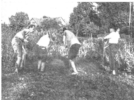
Fröhliche Helfer im Garten

Die Kurse dauern – wie angedeutet – ein halbes Jahr, beginnend mit Mitte April. Aufgenommen werden Mädchen von 18 Jahren an, weil sich herausgestellt hat, daß man ein gewisses Mindestalter einhalten muß, wenn man zu vollem Erfolg kommen will. Das Kursgeld beträgt Fr. 540.—. Stipendien ermöglichen es, auch solche aufzunehmen, die diesen Betrag nicht zahlen können. So sollen insbesondere auch erwerbslose Mädchen nicht vom Besuch des „Heims“ ausgeschlossen sein. – Ein Mütterferienheim