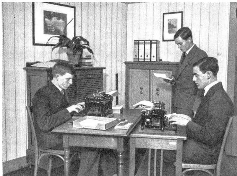
Monatsabschlussarbeiten bei der „Swiss Capitol Bank“. Kopf und Hände voll zu tun . . .

Arbeitsgemeinschaften, die sich nach den Grundsätzen eines kaufmännischen Betriebes aufbauen und angenommene Geschäftsvorfälle erledigen. Sie stehen via Zentrale mit den andern Firmen des Bundes in Verbindung zum Abschluß von Scheingeschäften.