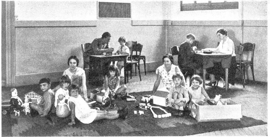
Im „Warteraum“ der medizinisch-pädagogischen Sprechstunde wird gespielt, was Anlaß zu mannigfaltigen psychologischen Beobachtungen gibt

Daß sich eine derartige Anstalt zur Ausbildung von ganz besonders befähigten Erziehungsfachleuten in hervorragender Weise eignet, versteht sich von selbst, wird aber auch durch den Umstand erhärtet, daß es zu jeder Zeit von Studierenden aller