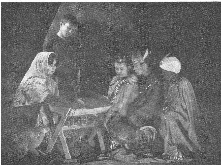
Krippenspiel in der Schule: „Anbetung der Hl. Drei Könige“. Aus dem „Deutschen Schulkalender“.