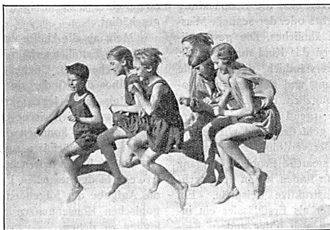
La chevauchée

J'étais chargé d'enseigner la musique et je ne trouvais arrêté par deux obstacles principaux. D'une part, mes élèves ne possédaient pas la faculté d'exécuter instantanément les ordres de leur volonté, et de l'autre, la tâche leur était compliquée par l'impossibilité où ils trou-