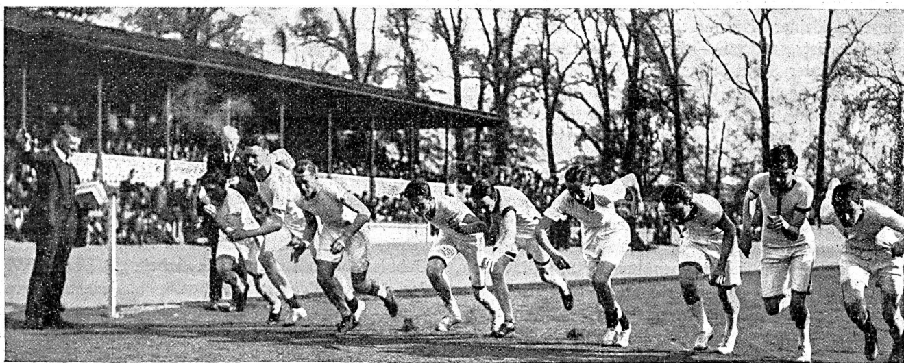
Start zum Wettlauf zwischen ehemaligen (Old Citizens) und jetzigen Schülern der City of London School

man nicht an eine verrückte Rekordwut der Jungens denken. Das gibt es auch, und wenn Eton gegen Harrow spielt, so ist das schlechthin Krieg, ein Krieg mit Heldentaten, mit Hass und mit Liebe. Aber im Grunde ist der Schulsport nur ein köstliches, fröhliches Spiel, ein Spiel mit Bällen und Farben. Man muss die feierlichen jungen Herrn mit ihren schwarzen Röcken und Zylinderhüten oder die Collegers mit ihrem Gelehrtenmäntelchen auf dem Spielplatz sehen, um sie zu verstehen — und zugleich um zu begreifen, was trotz allem das Verständigungsmittel zwischen Volksschülern und Etonboys ist. Auf dem Spielplatz fällt die schwarze Hülle — und ein höchst munterer, flinker, schlanker Junge läuft übers Feld. Hier ist alles Leben und alles Farbe. Die Farben, die „Colours“, sind die Geheimsprache der Boys. Die „Colours“, die Erringung des Rechts, diese oder jene Mütze oder Farbe tragen zu dürfen, sind ihr Ehrgeiz. Es sind mysteriöse Dinge. Der Laie erkennt nur ein entzückendes Bild von unzähligen bunten Mützen, Halstüchern, Hemden, Wolljacken, Strümpfen. Für die, die sie