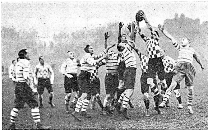
Spannender Moment (a line out) aus dem Rugby Cup in Richmond