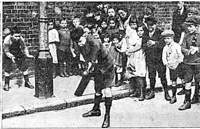
Sport im East End

sächlich befindet. Die jüngste Generation verspricht darum wohl einheitlicher und ausgeglichener erzogen zu werden als die Generationen, die hinter uns liegen. Dem Sport als Mittel zur Erziehung wird dabei durch die Demokratisierung der Spiele noch grössere Bedeutung zukommen als bisher.