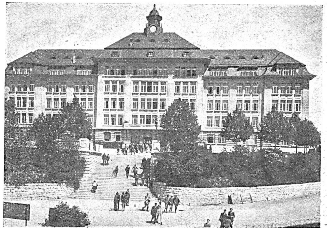
Höhere Handelsschule Lausanne