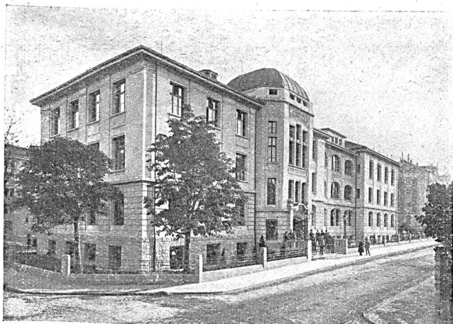
Handelshochschule St. Gallen

Der Besuch der kaufmännischen Fortbildungsschulen für Lehrlinge ist an den meisten Orten auf Grund kantonalen Gesetzes obligatorisch. Indessen war er schon vor