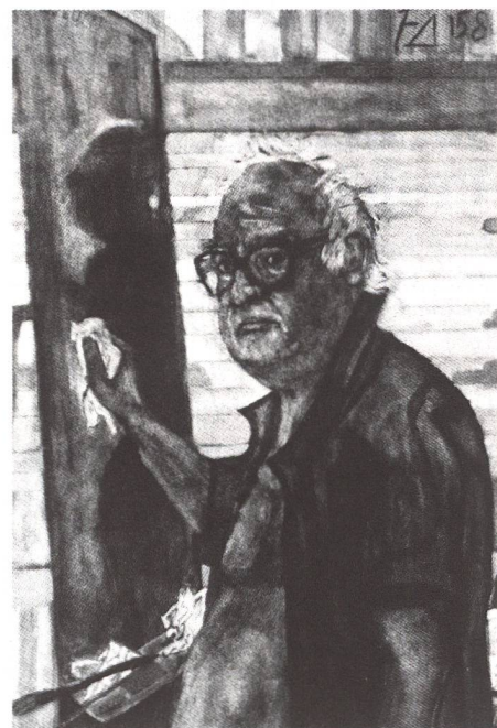
...und auf einem Selbstbildnis von 1982. Jahrzehntlang wussten nur Eingeweihte, dass der Dramatiker auch ein begabter Maler war.

Die bildende Kunst ist denn auch nicht einfach nur Nebenprodukt, sondern ein wichtiger Teil von Dürrenmatts Gesamtwerk, neben dem Schreiben das Mittel, zum Ausdruck zu bringen, was das Denken bewegt. Und aus diesem Denken, aus der Erfindung und nicht etwa aus der Beobachtung der Wirklichkeit (von ganz wenigen Porträts abgesehen) stammen Dürrenmatts Bilder. Sie sind düster, expressionistisch und zeigen, genauso wie das schriftstellerische Werk, karikierend, verzerrend, eine Gegenwelt. Freilich sind nicht alle Motive reine Erfindung, sondern sehr viele Figuren stammen aus dem Alten Testament