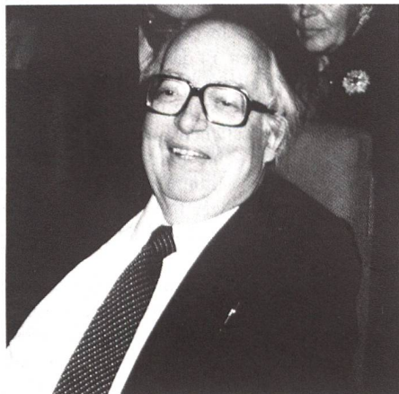
Friedrich Dürrenmatt während der Verleihung des Georg-Büchner-Preises (1986)...

In einem andern Theaterstück, es ist wohl das berühmteste, im «Besuch der alten Dame», wird deutlich Dürrenmatts Einsatz für die hohen (antiken) Ideale der Gerechtigkeit und Humanität sichtbar. Die Multimillionärin Claire Zachanassian kehrt in ihre Heimatstadt Gölten zurück, um Rache zu nehmen für ein vor langer Zeit an ihr begangenes Unrecht. Als schwangere Kläri Wäscher war sie seinerzeit von ihrem Geliebten Ill als Dirne verleumdet und von der Stadt verstossen worden. Nun ist sie bereit, das bankrotte Gölten mit ihrem Reichtum zu sanieren, aber nur unter der Bedingung, dass sich «ihre» Gerechtigkeit durchsetzt, was in ihren Augen «totale Rache» und nichts weniger als der Tod ihres ehemaligen Geliebten Ill heisst. Tief entrüstet, «im Namen der Menschlichkeit», auf die sie sich jetzt plötzlich besinnen,