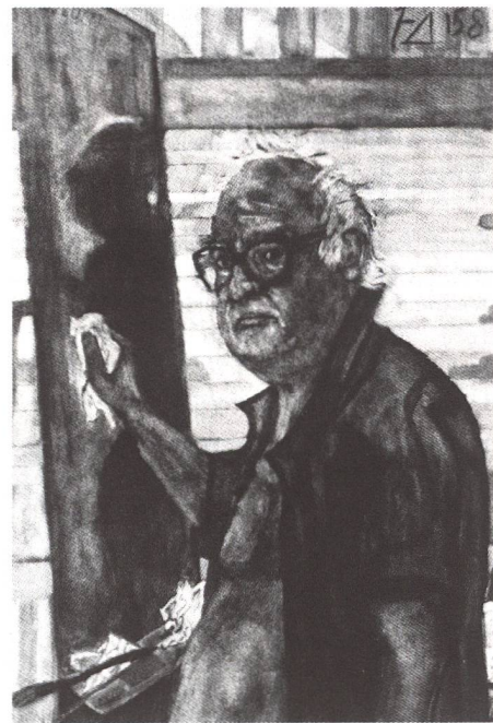
...und auf einem Selbstbildnis von 1982. Jahrzehntelang wussten nur Eingeweihte, dass der Dramatiker auch ein begabter Maler war.

Die bildende Kunst ist denn auch nicht einfach nur Nebenprodukt, sondern ein wichtiger Teil von Dürrenmatts Gesamtwerk, neben dem Schreiben das Mittel, zum Ausdruck zu bringen, was das Denken bewegt. Und aus diesem Denken, aus der Erfindung und nicht etwa aus der Beobachtung der Wirklichkeit (von ganz wenigen Porträts abgesehen) stammen Dürrenmatts Bilder. Sie sind düster, expressionistisch und zeigen, genauso wie das schriftstellerische Werk, karikierend, verzerrend, eine Gegenwelt. Freilich sind nicht alle Motive reine Erfindung, sondern sehr viele Figuren stammen aus dem Alten Testament