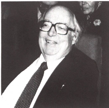
Friedrich Dürrenmatt während der Verleihung des Georg-Büchner-Preises (1986)...

In einem andern Theaterstück, es ist wohl das berühmteste, im «Besuch der alten Dame», wird deutlich Dürrenmatts Einsatz für die hohen (antiken) Ideale der Gerechtigkeit und Humanität sichtbar. Die Multimillionärin Claire Zachanassian kehrt in ihre Heimatstadt Gullen zurück, um Rache zu nehmen für ein vor langer Zeit an ihr begangenes Unrecht. Als schwangere Kläri Wäscher war sie seinerzeit von ihrem Geliebten Ill als Dirne verleumdet und von der Stadt verstossen worden. Nun ist sie bereit, das bankrotte Gullen mit ihrem Reichtum zu sanieren, aber nur unter der Bedingung, dass sich «ihre» Gerechtigkeit durchsetzt, was in ihren Augen «totale Rache» und nichts weniger als der Tod ihres ehemaligen Geliebten Ill heisst. Tief entrüstet, «im Namen der Menschlichkeit», auf die sie sich jetzt plötzlich besinnen,