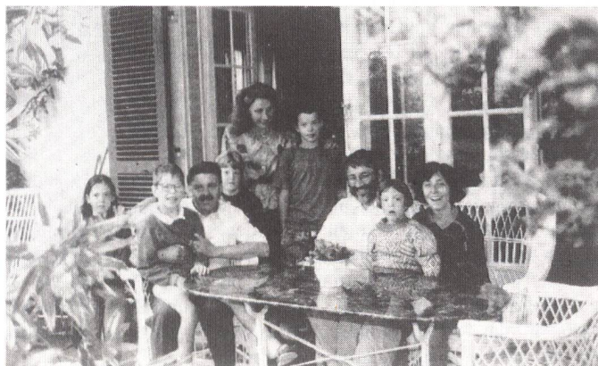
Eine Auslandschweizerfamilie schliesst Freundschaft mit ihren Gastgebern.

Auf Wunsch vermittelte «Solothurn» den Gästen auch Reisebegleiter für einen Tag. Für diese Dienstleistung haben sich Freiwillige gemeldet, die selber kein Logis anbieten konnten, die aber trotzdem einen aktiven Beitrag zur 700-Jahr-Feier leisten wollten. Darüber hinaus sind bei der Aktion Begegnung 91 unaufge-