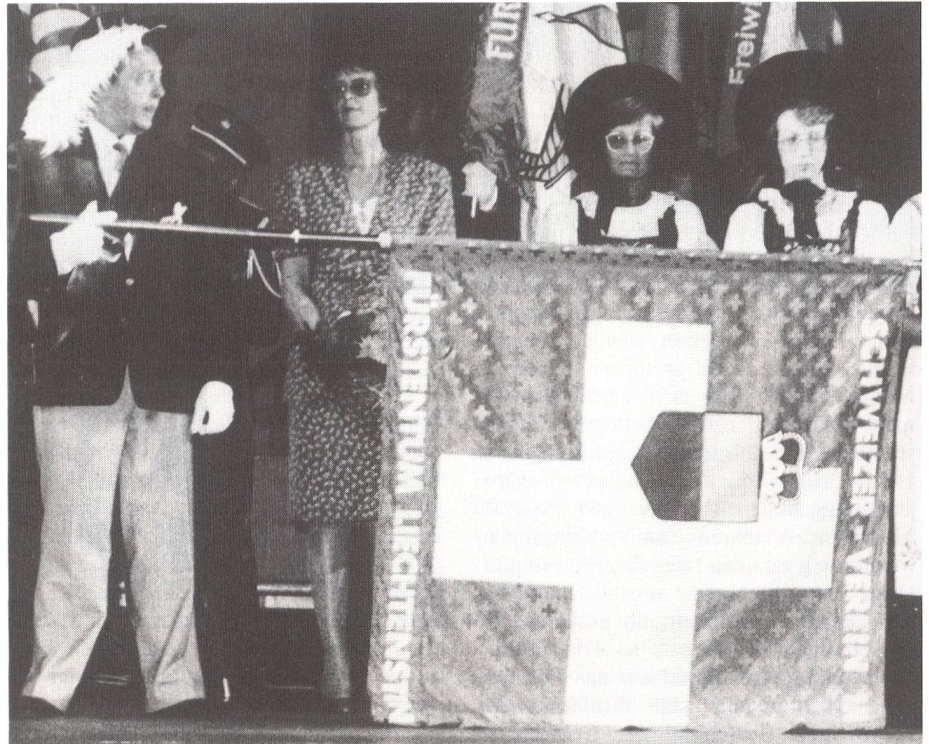
Die neue Vereinsfahne frisch entrollt