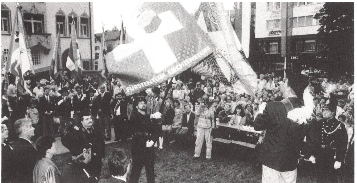
Gespannte Blicke beim Fahngross – machen es die Fähnriche richtig?

Und wenn nun dieser Baum Schweiz in der Vergangenheit keineswegs nur gute Früchte trug und auch in Zukunft nicht nur gute Früchte trägt, so wollen wir heute und auch morgen nicht das Negative in den Vordergrund stellen. Lasst uns im Gegenteil einmal die Vielfalt und Schönheit des Landes bewundern – und da darf ich heute sicher das Tessin als unsere Sonnenstube hervorheben. Beachtung verdient auch, dass trotz Vorhandenseins verschiedener