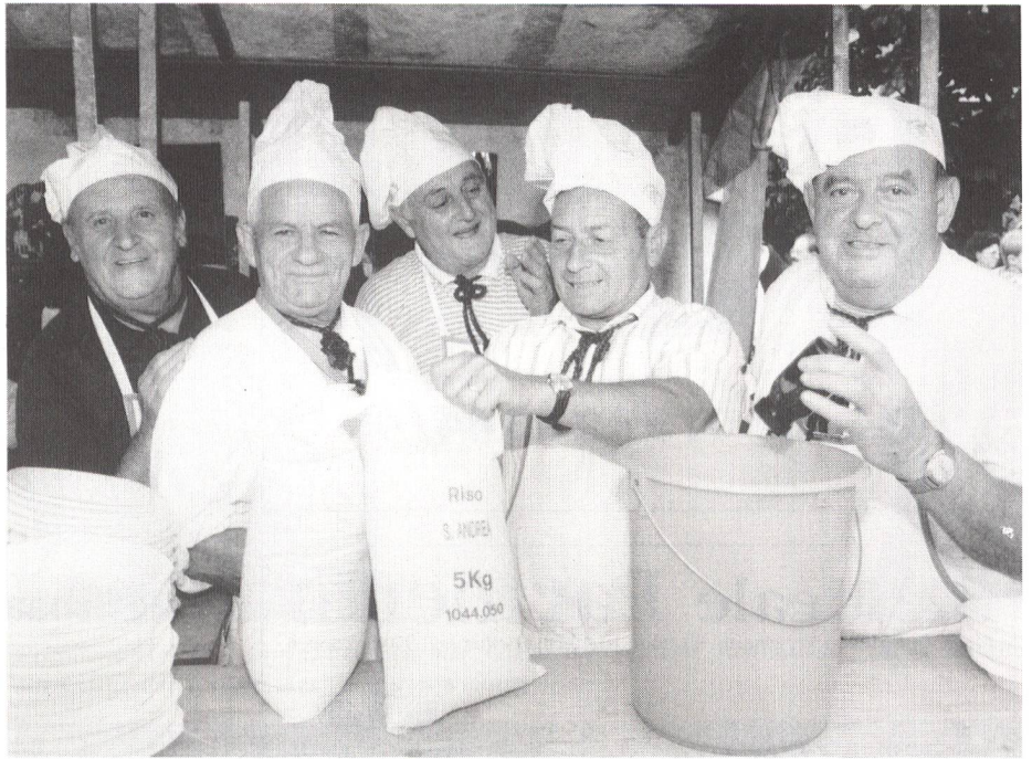
Risotto-Köche zum Start bereit

Um 8 Uhr des 1. August wurde auf dem Rathausplatz der Tessiner Markt eröffnet. Den Besuchern wurde eine reiche Auswahl an Tessiner Spezialitäten angeboten. Ein Sortiment von Salami und andern Würsten sowie von verschiedenen Hart- und Weichkäsen liessen einem das Wasser im Mund zusammenlaufen. Daneben gab es Teigwaren in allen Farben, Panettoni,