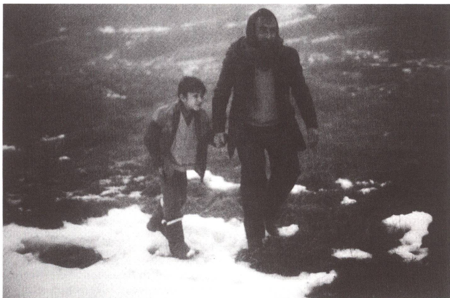
Neben Denkmalpflege und Heimatschutz ist nur noch die Filmförderung in der Verfassung verankert. Unsere Bilder: Szenen aus dem Film «Reise der Hoffnung» von Xavier Koller.

Halten wir als Zwischenergebnis fest: Kunstwerke sind nicht für die industrielle Massenproduktion geeignet (wobei Ausnahmen durchaus die Regel bestätigen können, meist jedoch kaum zu Lebzeiten des Künstlers). Hinzukommt ein die Einnahmensituation wesentlich verschlechterndes Charakteristikum der Kulturszene Schweiz. Sie ist zwar ungeheuer vielfältig und reich an Ausdrucksformen, jedoch meist extrem