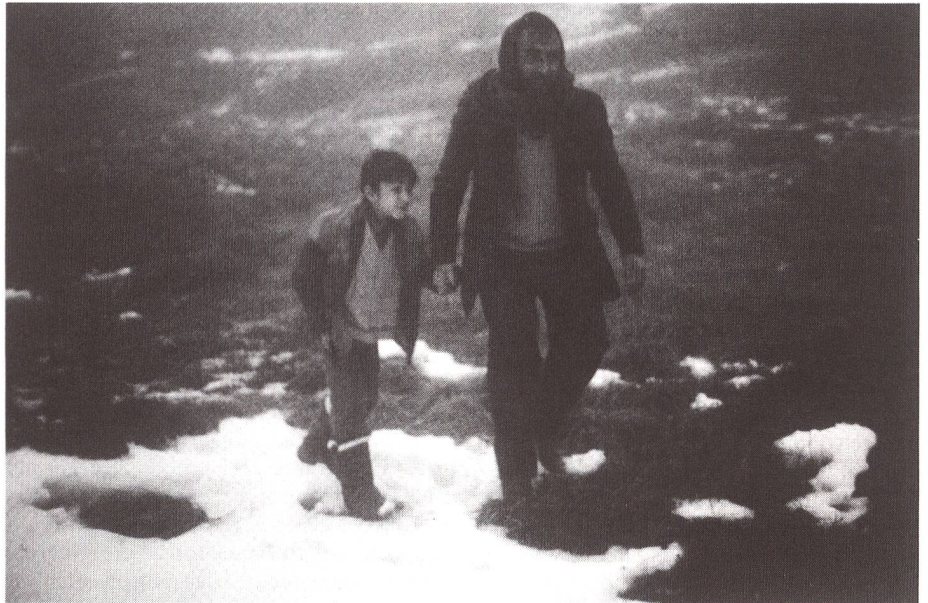
Neben Denkmalpflege und Heimatschutz ist nur noch die Filmförderung in der Verfassung verankert. Unsere Bilder: Szenen aus dem Film «Reise der Hoffnung» von Xavier Koller.

Halten wir als Zwischenergebnis fest: Kunstwerke sind nicht für die industrielle Massenproduktion geeignet (wobei Ausnahmen durchaus die Regel bestätigen können, meist jedoch kaum zu Lebzeiten des Künstlers). Hinzu kommt ein die Einnahmensituation wesentlich verschlechterndes Charakteristikum der Kulturszene Schweiz. Sie ist zwar ungeheuer vielfältig und reich an Ausdrucksformen, jedoch meist extrem