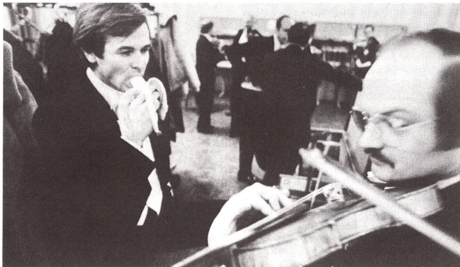
Vor dem Konzert.