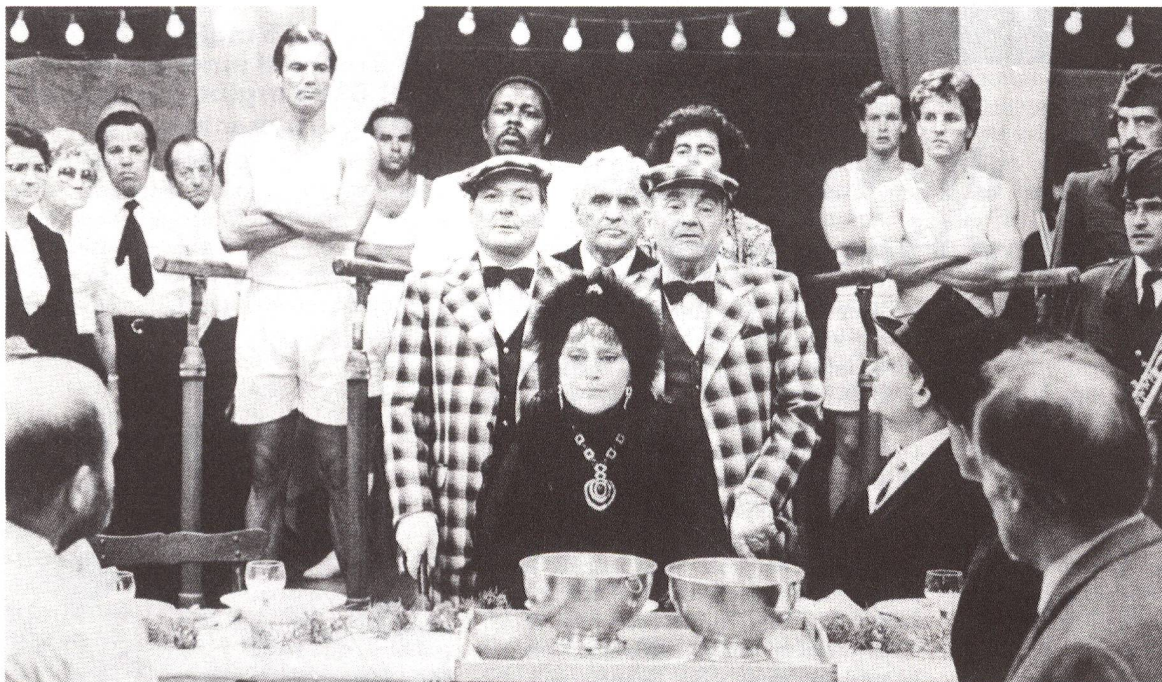
Auch im revidierten Urheberrechtsgesetz ist geistiges Eigentum nicht geschützt, z. B. vor Raubkopien auf Videokassetten. Unser Bild: Szene aus «Der Besuch der alten Dame» von Friedrich Dürrenmatt, mit Maria Schell in der Titelrolle.

trefflich schreiben. Die entsprechenden Meinungen reichen von Nulltarif bis zu Idealisten- und Liebhaberpreisen, eine Auseinandersetzung, die wohl niemals zu beenden sein wird. Wer als Privater – sei es als natürliche Person oder als Unternehmer – in grösserem Umfang Geld in die Kultur steckt und dafür eine Gegenleistung erwartet oder fordert, wird heute meist mit dem Modebegriff «Sponsor» bedacht. Das sogenannte «Sponsoring» macht Schule und hat einen festen Platz in unserem Sprachgebrauch gewonnen. Nicht jede Unterstützungsleistung hat jedoch mit Sponsoring zu tun. In einer, allerdings etwas vereinfachten, Schematisierung (die Grenzen sind wie vielerorts durchaus fließend) kann, wie bereits angedeutet, der Sponsor vom anderen, klassischen privaten Geldgeber, dem Mäzen, dadurch unterschieden werden, dass er den Kulturbetrieb als ein Gebiet (wie auch andere, z. B. den Sport) betrachtet, in dem sich Partner