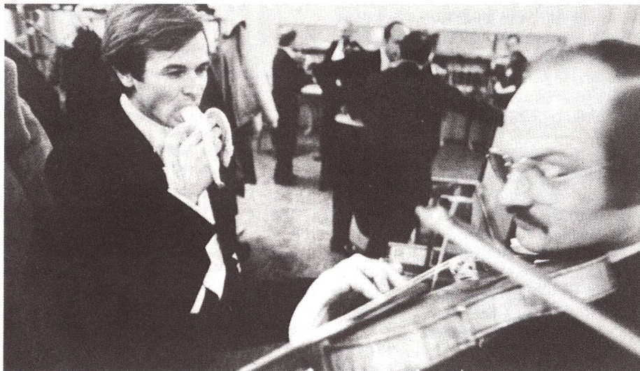
Vor dem Konzert.