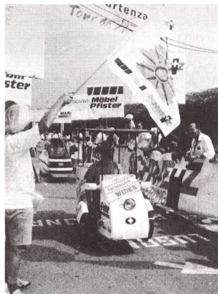
Solarmobilrennen «Tour de Sol» als Schrittmacher der Sonnenenergie in der Schweiz.

■ Bereits letztes Jahr wurde auf dem Titlis eine Solaranlage mit einer Leistung von 2,5 kW in Betrieb genommen. Sie ist die höchstgelegene (2540 m) Solaranlage mit Netzeinspeisung der Welt. Sie dient unter anderem der Erforschung von Solaranlagen unter extremen Witterungsbedingungen. sd