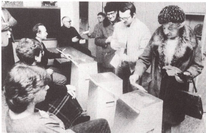
Auslandschweizer werden sich nicht mehr persönlich an die Urne begeben müssen.

Der Bundesrat hat am 15. August 1990 den Entwurf zur Revision des Bundesgesetzes über die politischen Rechte der Auslandschweizer und somit zur Einführung des Korrespondenzstimmrechts vom Ausland her verabschiedet.