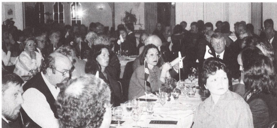
Blick in den grossen Versammlungskreis.